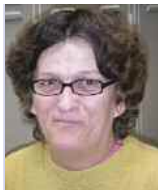
Annette Firmenich Verpackung

Ich arbeite seit 2001 mit viel Spaß. Ich mache die wichtigste Arbeit in der Gruppe und bin ganz selten krank. Ich hatte schon mal Ärger mit den Gruppenleitern, aber hier ist es jetzt gut.