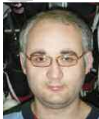
Cemal Coban Eissporthalle

Ich mag mehr Teamarbeit als Einzelarbeit. Dann ist die Motivation stärker. Wenn man viel alleine macht, lässt man sich hängen und wird zurückgestuft.