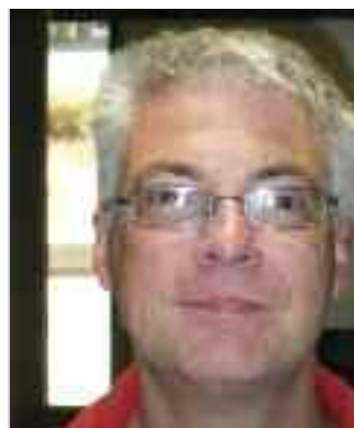
Jörg Fuchs Eissporthalle

Ohne die Arbeit hätten wir heutzutage nichts. Mir gefällt Arbeit. Ich bin fleißig dabei. Nur zwei Mann dürfen hier in diese Anlage. Wir wechseln uns ab.